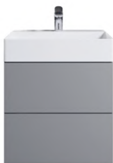
Typ F Tipmatic push-to-open