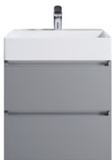
Typ A Grifflos, Kehrleiste in Aluminium