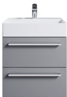
Typ D Knauf / Griff siehe Kapitel 15