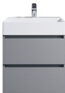
Typ C Grifflos, Kehrleiste in Korpusfarbe