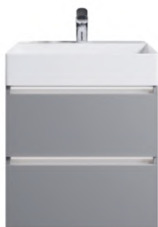
Typ B Grifflos, Kehrleiste inkl. LED Beleuchtung